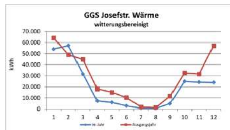
Verbrauchsauswertung durch e&u

Ein Bild sagt mehr als tausend Zahlen: Tragt die monatlichen Heizenergie-, Strom- und Wasserverbräuche in ein Schaubild (Diagramm) ein und hängt die Diagramme aus. So wird der Verbrauch anschaulich. Ihr seid digital gut aufgestellt? Dann stellt die Verbrauchsentwicklung online im Schulnetz dar. Die monatlichen Veränderungen wecken Aufmerksamkeit und bieten Gesprächsstoff.